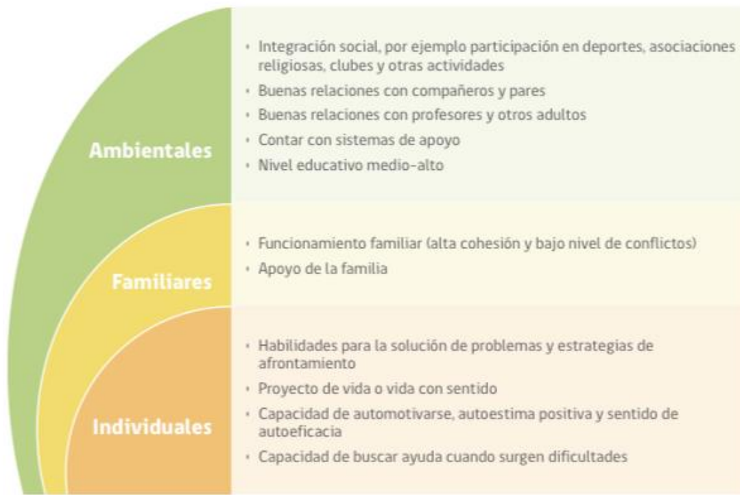
FIGURA 2. FACTORES PROTECTORES CONDUCTA SUICIDA EN LA ETAPA ESCOLAR