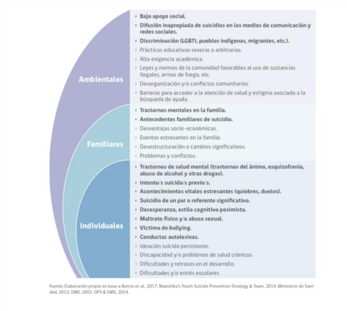
FIGURA 1. FACTORES DE RIESGO CONDUCTA SUICIDA EN LA ETAPA ESCOLAR